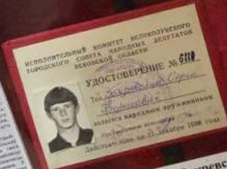
Удостоверение С. Закревского