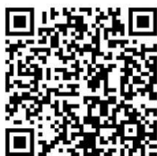
Рисунок 1. QR-код для прохождения упражнений Google Forms